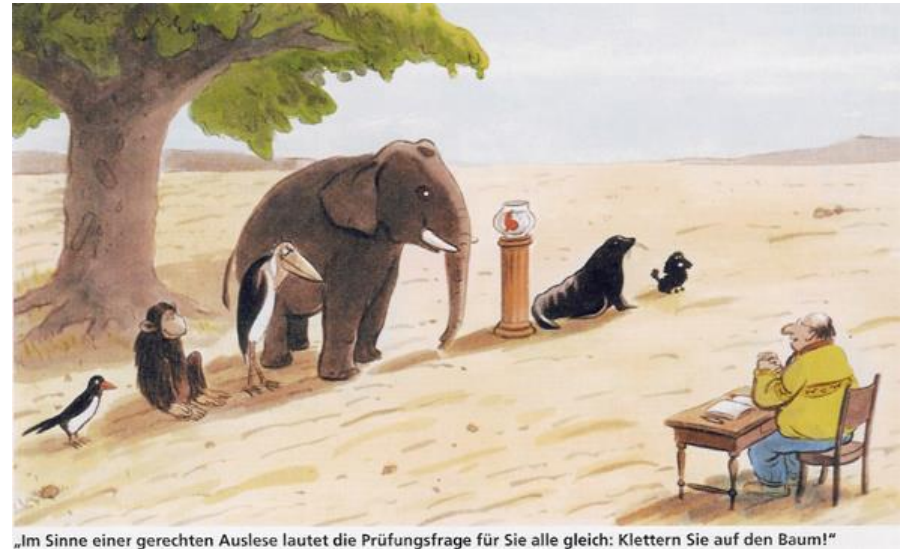
„Im Sinne einer gerechten Auslese lautet die Prüfungsfrage für Sie alle gleich: Klettern Sie auf den Baum!“