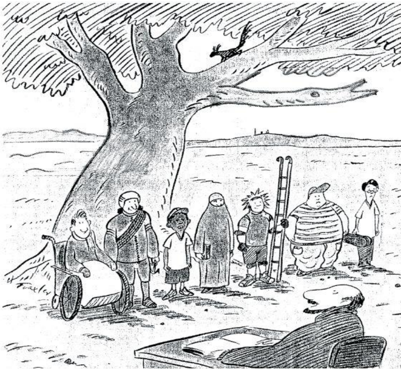
Zeichnung: Hans Traxler, in »Erziehung und Wissenschaft« 2/2001

Zum Ziel der gerechten Auslese lautet die Aufgabe für alle gleich: Klettert auf den Baum!